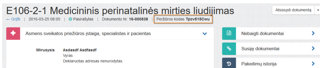
3 paveikslas. Pažymos peržiūros kodas

Sistema sugeneruoja pažymos peržiūros e. sveikatos viešajame portale kodą, kuris parodomas atnaujintame medicininės pažymos peržiūros lange.