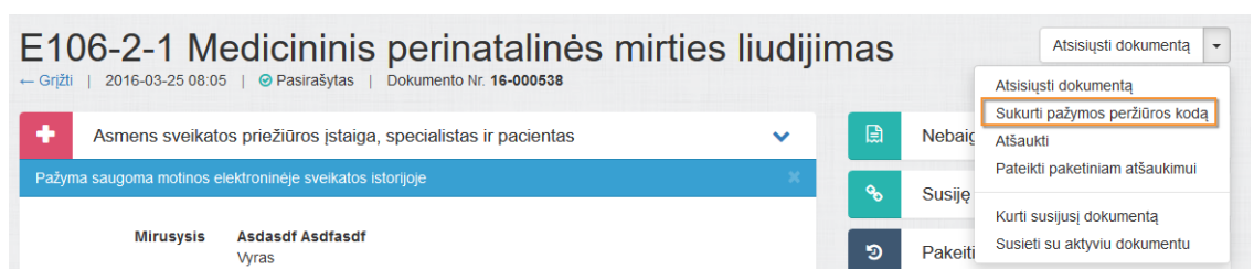
1 paveikslas. Sukurti pažymos peržiūros kodą

2.2. Išskleidžiamame meniu pasirinkti Sukurti pažymos peržiūros kodą .