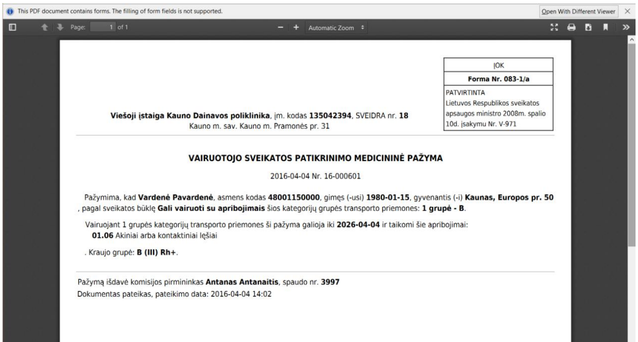
5 paveikslas. Pažymos pdf dokumentas e. sveikatos viešajame portale

Sistema parodo naudotojui medicininės pažymos pdf dokumentą, pasirašytą kvalifikuotu elektroniniu parašu. Naudotojas gali peržiūrėti dokumentą ir išsisaugoti jį savo kompiuteryje, atsispausdinti.